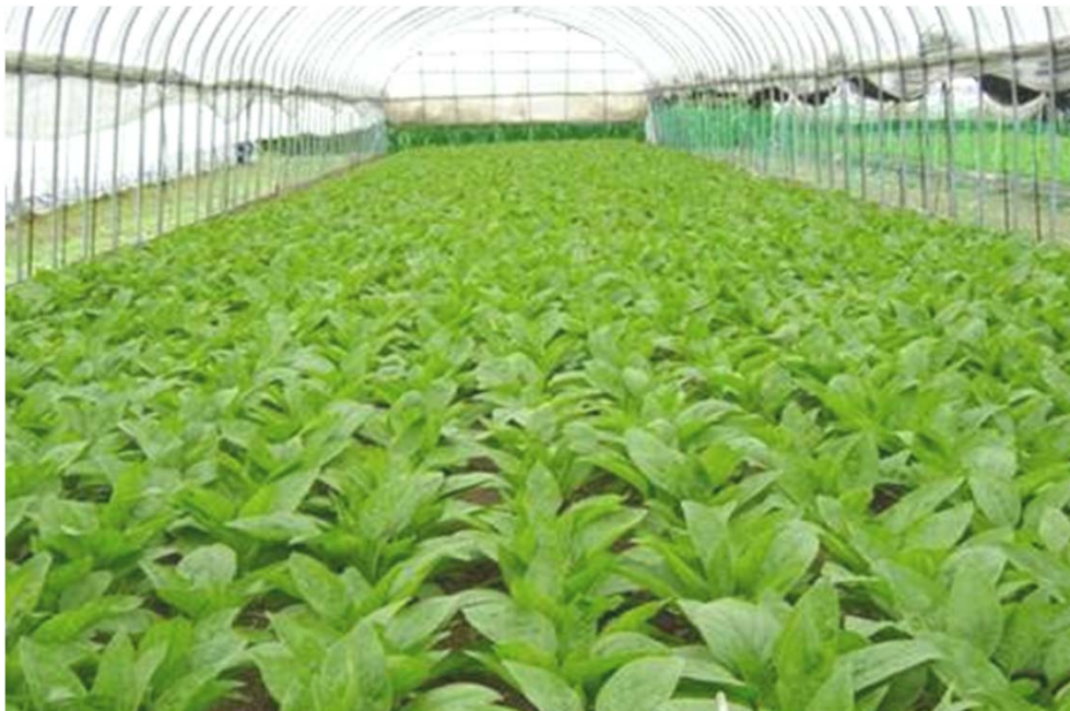
マインマグC施用区 60kg/10a施用